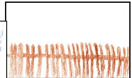
Aneta, lat 9