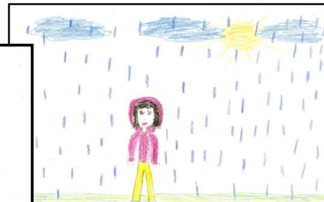
Zuzia, lat 10