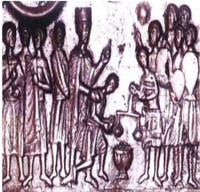
Ilustracja nr 2

Drzwi ozdobione 18 scenami z życia świętego Wojciecha