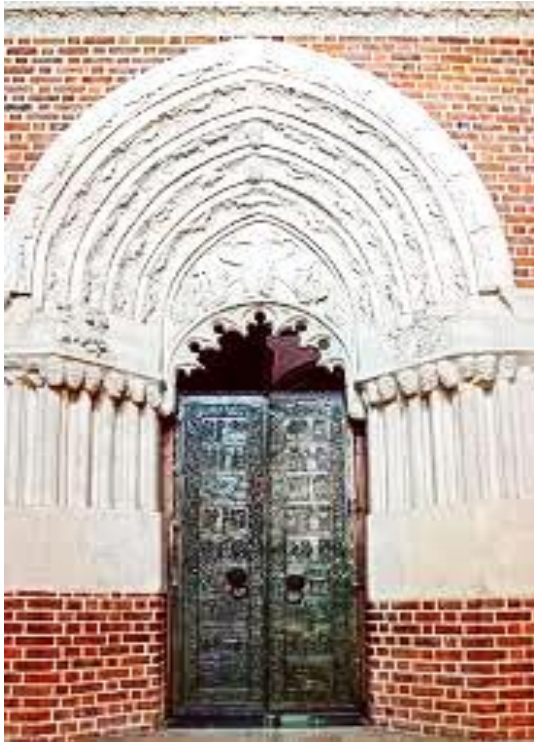
Ilustracja nr 1

Drzwi ozdobione 18 scenami z życia świętego Wojciecha