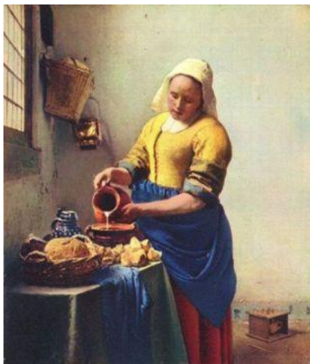
Jan Vermeer van Delft, Mleczarka (lub Dziewczyna z dzbanem mleka ), ok. 1660